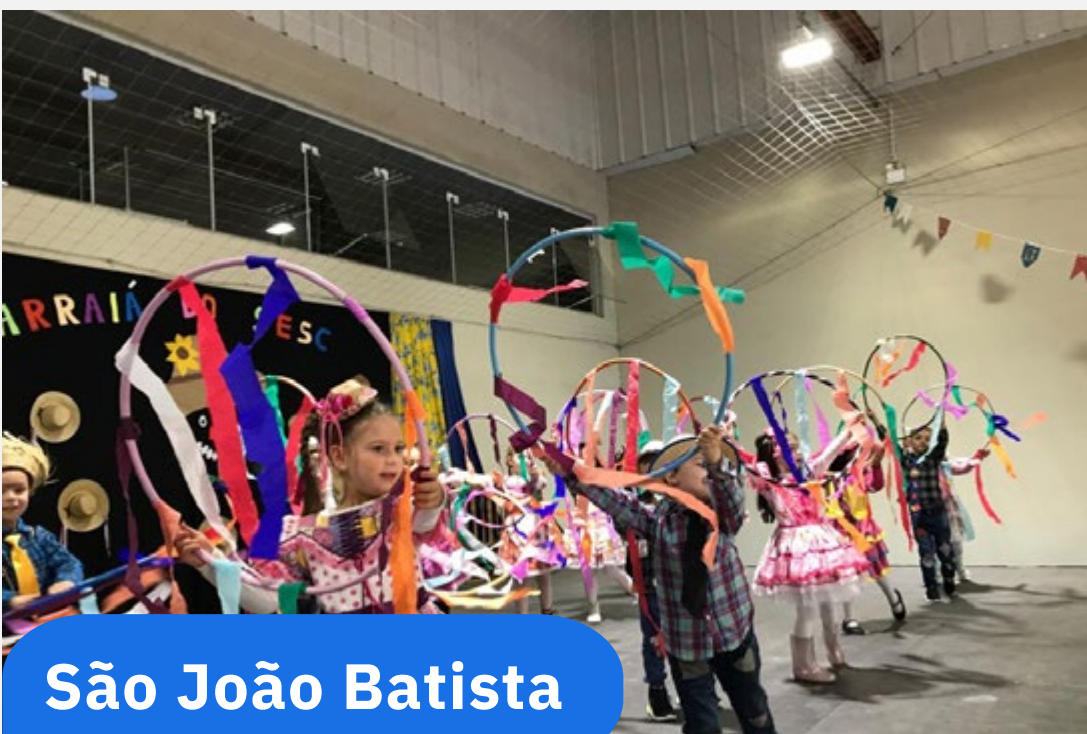
São João Batista