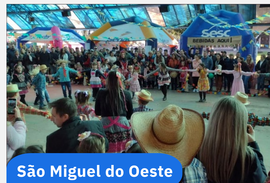
São Miguel do Oeste