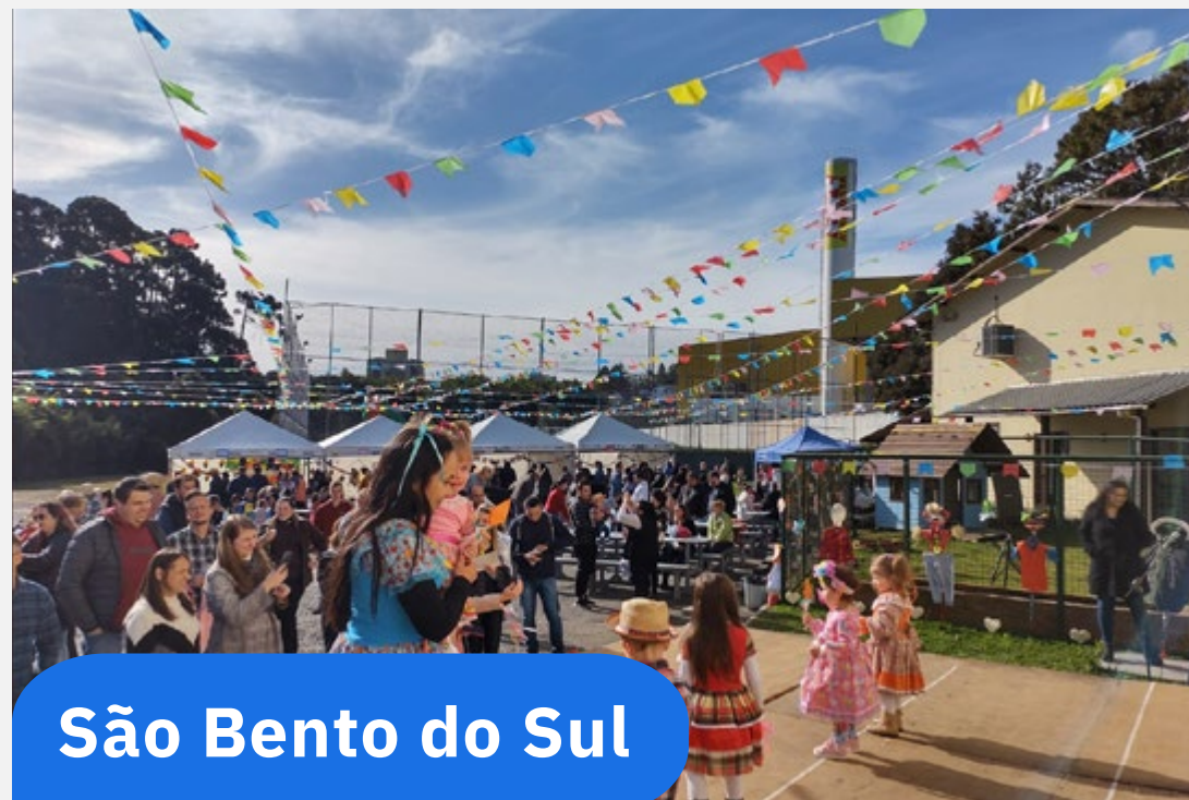
São Bento do Sul