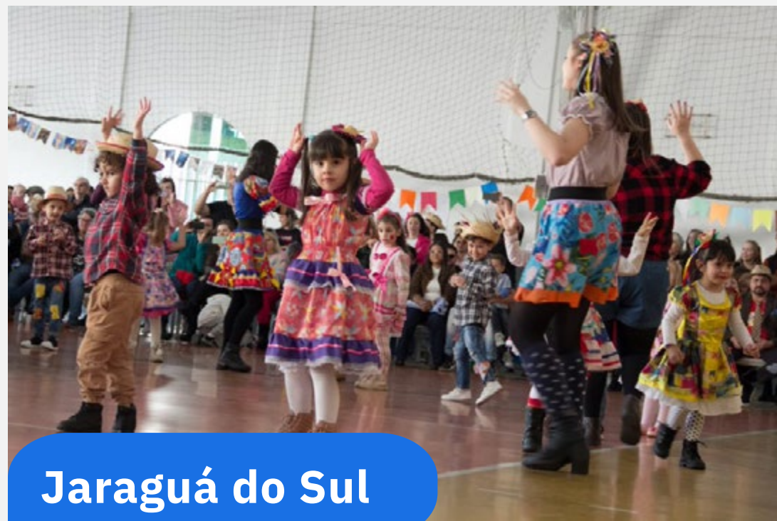
Jaraguá do Sul